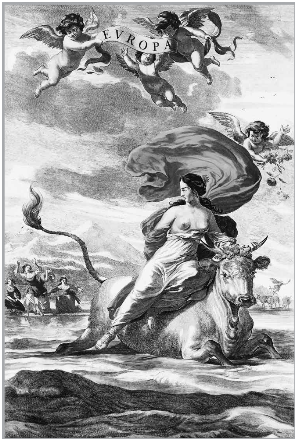
Európa allegóriája Joan Blaeu Atlas Maior című munkájából, 1662