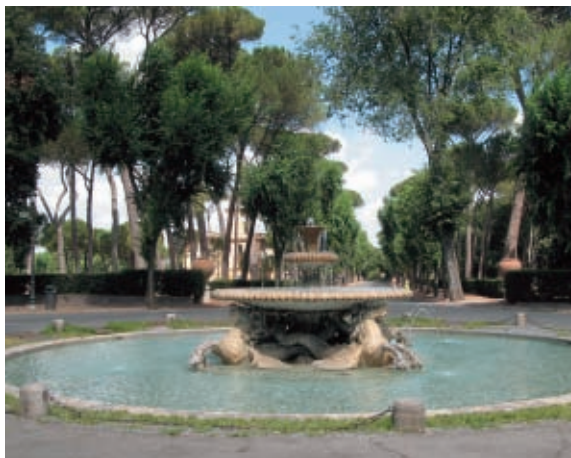
A Villa Borghese parkjában óráig sétálhatunk