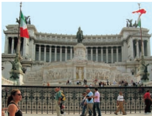
A Vittorio Emanuel-emlékmű

nuel-emlékmű láttán nehéz elhinni, hogy az ókori főváros központi dombja, szentélyei és fóruma innen csak pár lépésre emelkedik. A hatalmas esküvői tortára emlékeztető Vittoriano az egyesült Olaszország első uralkodójának tiszteletére épült. Szemben találjuk az egykori bíborosi palotát, a Palazzo Venezia -t. A szépséges épület később királyok és államférfiak hivatalaként működött: itt lakott az osztrák nagykövet, majd 1922-ben erkélyéről Mussolini mondott beszédet. Múzeumában 13–18. századi festményeket, szobrokat, faragványokat, ezüst- és üvegnyomtatványokat tekinthetünk meg (nyitva K–V 8.30–19.30-ig, belépődíj van).