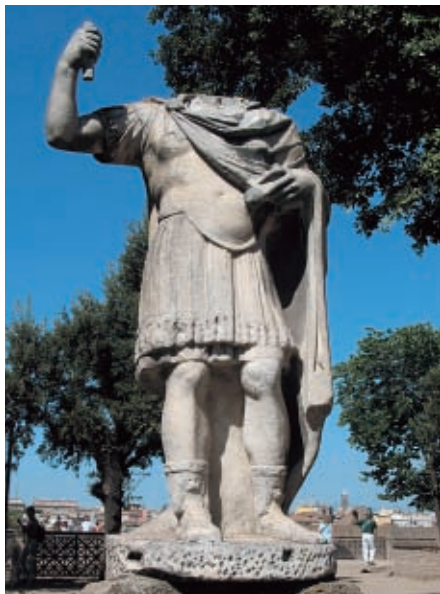
Császárszobor a Palatinus-dombon