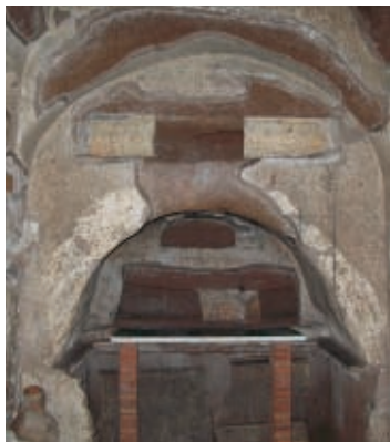
A katakombákba lemerészkedve megtapasztalhatjuk, milyen volt az ókeresztény közösségek élete