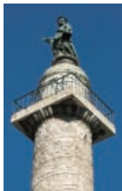
Traianus császár oszlo- pának dom- borművei