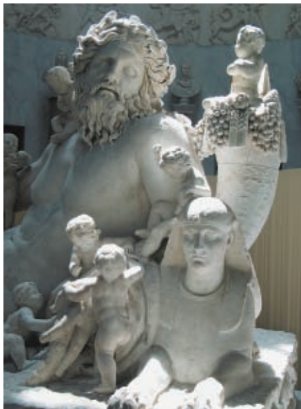
Díszes szarkofág a Vatikáni Múzeumban