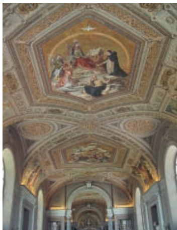
A Vatikáni Könyvtár mennyezetfreskója