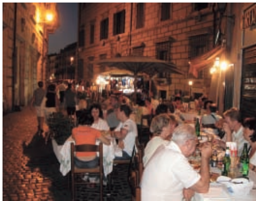
Esténként nincs is jobb, mint kiülni valamelyik pizzéria teraszára