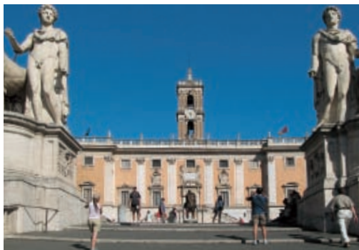
A Piazza del Campidoglio szobrai

A Capitolium-dombról képeslapra illő kilátás nyílik a Forumra , az ókori Róma központjára. Itt zajlott az élet a szentélyek és piacok körül, itt tartották a politikai beszédeket és a diadalmas hadjáratok utáni ünnepi felvonulásokat. A császári teret, a Fori Imperialit Caesartól Traianusig uralkodók sora építette (nyitva K–V 9–19 óráig, belépődíj van). A vásárcsarnokok mellett álltak itt templomok, könyvtárak és oszlopszarnokok is. Múzeuma Traianus egykori piaca helyén fekszik, itt láthatók a legutóbbi ásatás során előkerült maradványok. Egy közeli kis téren magasodik a császár oszlopa , mely