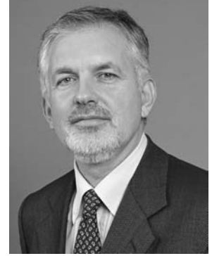
Dr. Páva Zsolt Pécs polgármestere