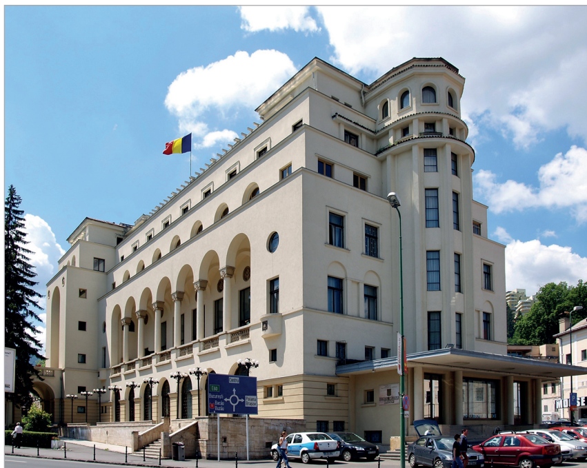
1. kép: Az 1930–40-es években emelt Tisza Kaszinó (Cercul Militar) épülete Brassóban

Noha a két világháború közötti, Erdélyre és a többi elcsatolt területre irányuló figyelem nem volt állandó, és a megszakás, illetve a mindenféle újabb ügyek miatt idővel lanyhult, a kormányzat és az érdekeltek igyekeztek azt folyamatosan fenntartani. Abban bíztak, hogy a megfelelő időben majd lehetőség nyílik a mélységesen igazságtalannak és elfogadhatatlannak érzett békeszerződés revideálására, Magyarország pedig legalább részben vissza tudja szerezni az elvesztett területeket. Jóllehet a revizionista diskurzus a békeszerződés aláírását, majd ratifikálását követően évekre visszaszorult, az 1920-as évek végén, a nemzetközi körülmények módosulásával újra megjelent, és egyre nagyobb teret hódított a közbeszédben. 7 Tulajdonképpen integrálta az ebben az időszakban