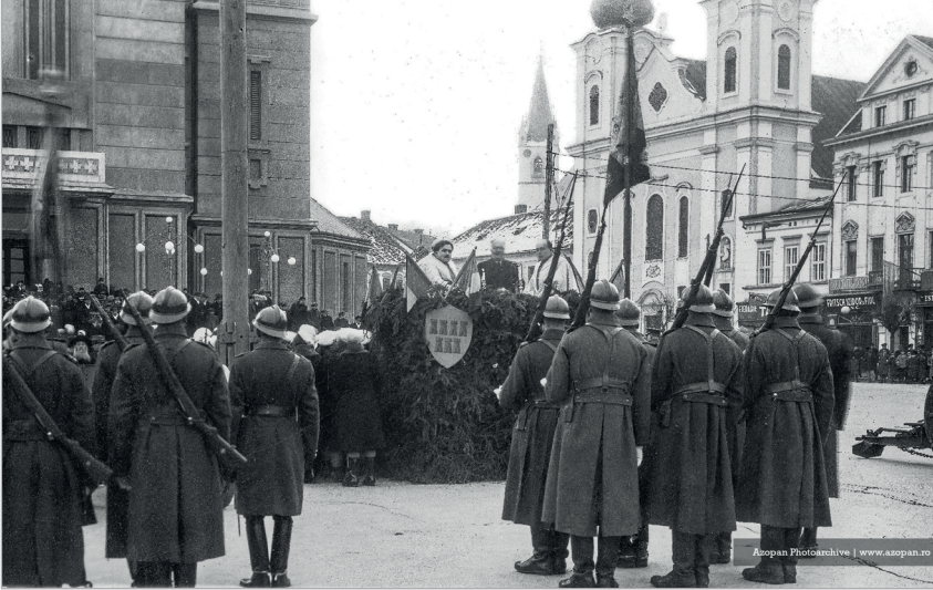
A képen: sorozottak eskütétele Marosvásárhely főterén, 1940. január.