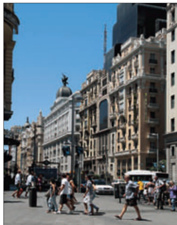
Az elegáns üzletekkel szegélyezett Gran Vía Madrid „főutcája”