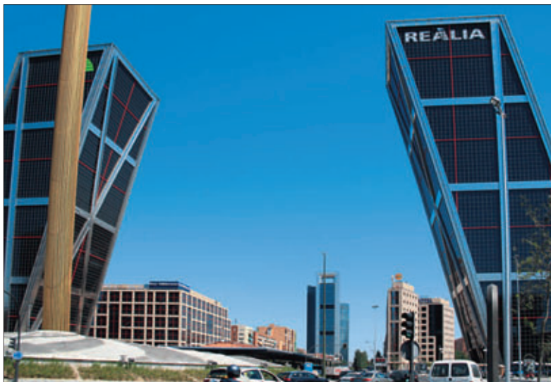
A spanyol főváros egyik nevezetessége: a Torres Kío egymás felé „dőló” ikertornyai