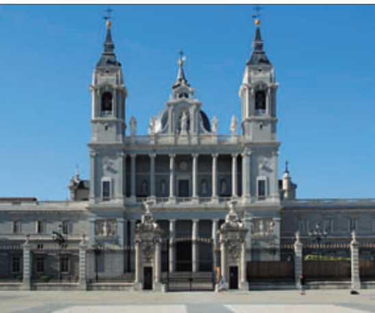
Az Almudena-katedrális Madrid egykori mecsetje helyén áll