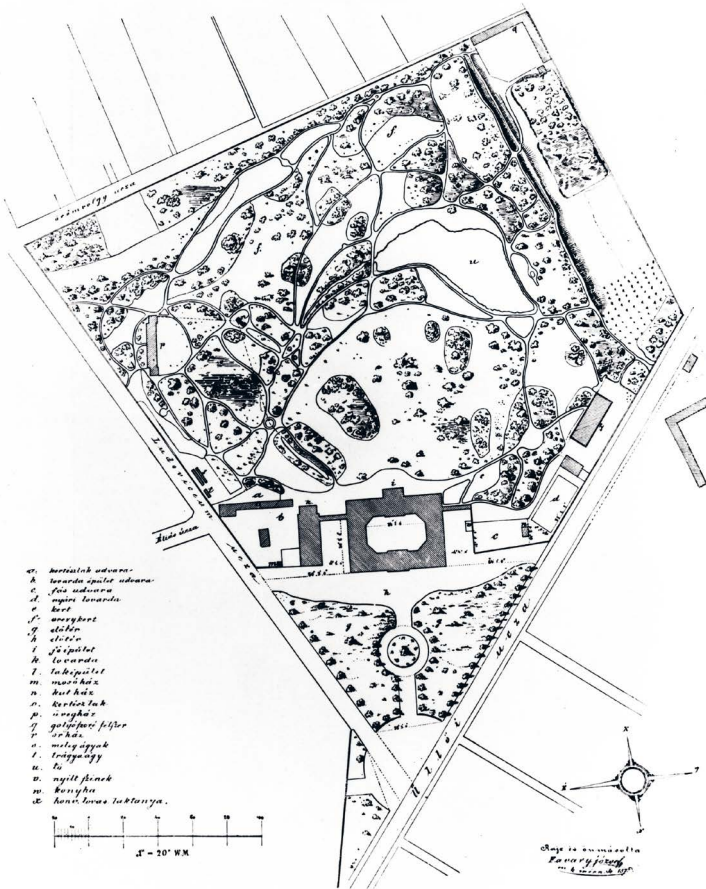
A Ludovika Akadémia térképe 1872-ben