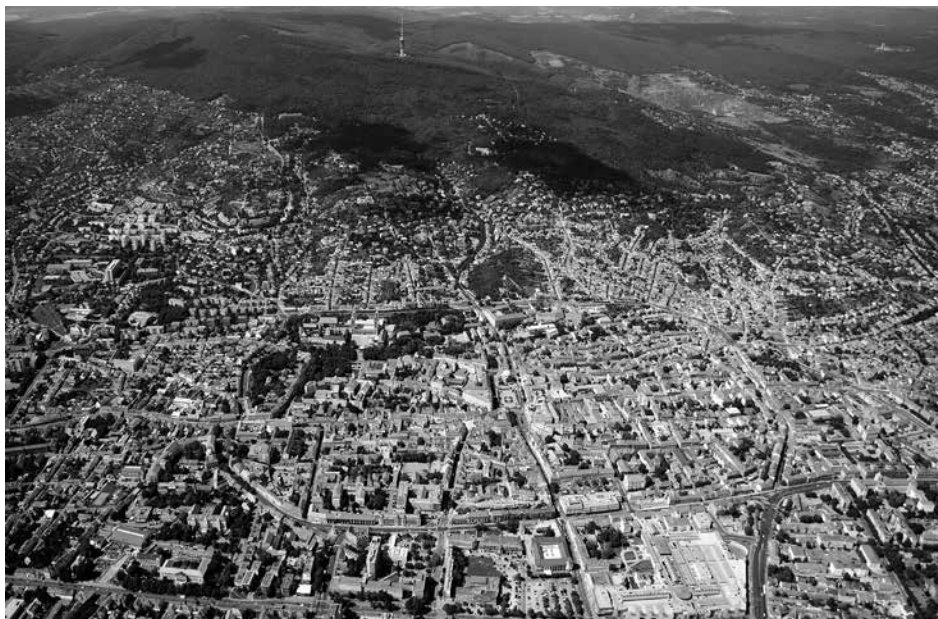
1. ábra. Pécs légi felvételen

A Mecsek területén a karsztos jelleg ellenére fejlett vízhálózat alakult ki. A felszíni vizek táplálói a Mecsek karsztos forrásai, amelyek alapvető szerepet töltek be a lakosság vízellátásában, s így a források a település kialakulásának és fejlődésének egyik alappilléret képezték. Az egykoron igénybe vett források közül ma már csak néhányról tudunk, hiszen a völgytalpak a későbbiekben átalakultak, részlegesen feltöltődtek (Petrzszelyem-forrás, Kaposvári utcai-forrás, Tettye forrás). 4 A történeti városmag területén több, forrás táplálta, a kőzettani adottságok miatt jobbára ideiglenesen működő, kisebb felszíni vízfolyással kell számolni. 5 Pécs történeti fejlődése szempontjából két felszíni vízfolyás jelentős: Pécs területéről az elfolyó felszíni vizek befogadója a Pécsi-víz. A Pécsi-medence alján a mocsaras völgyével sokáig határoló szerepet töltött be, az újkortól ipari vízként is hasznosították. A középkori város falát keletről határoló Tettyepatak energiát biztosított a partjára épült malmok számára, ipari vizet a bőrfeldolgozáshoz, de közvetetten védelmi funkciót is ellátott. A Mecsek délnyugati előterében a Pécsi-síkság – a széles Dráva árokrendszer peremi tagjaként – a pleisztocénben jött létre, a süllyedést kitöltő hordalékkúpnak Pécs vízellátásában fontos a szerepe. 6