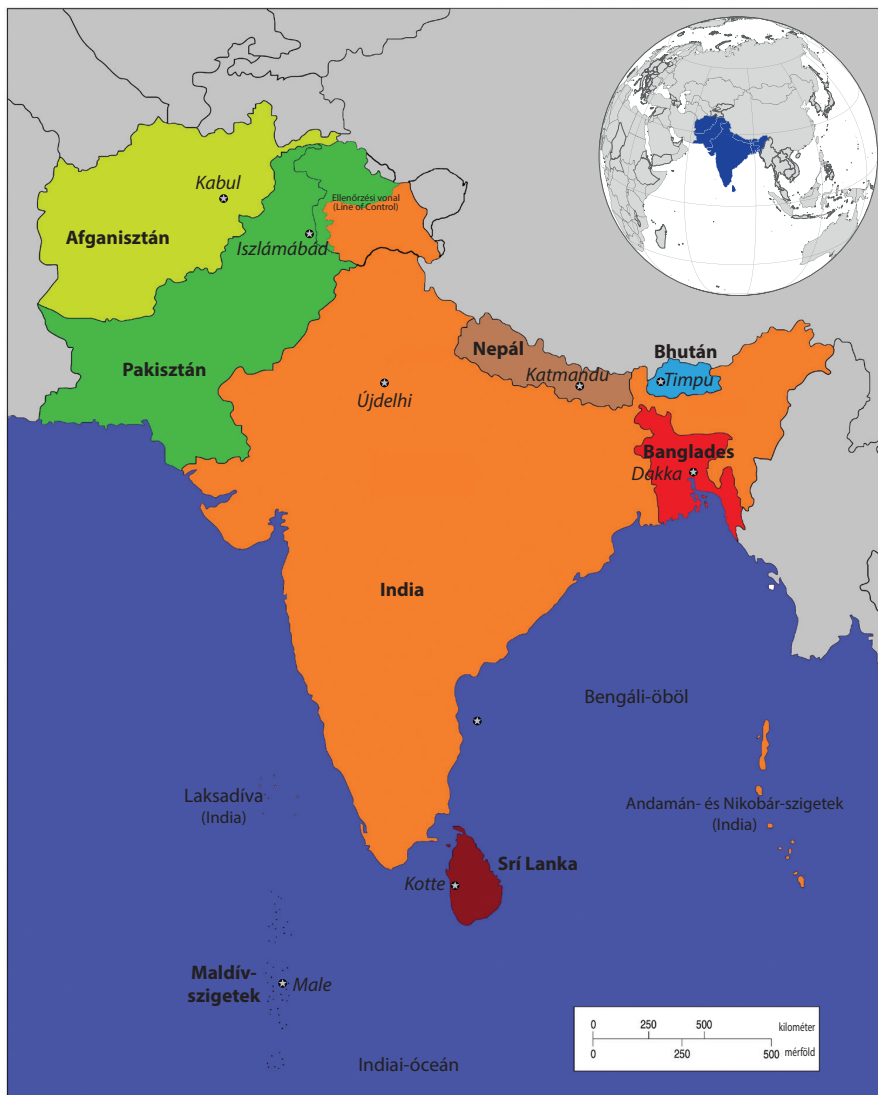
1. ábra: Dél-Ázsia országai a 21. század második évtizedének végére

a történettudomány, a politikatudomány és a nemzetközi és biztonsági tanulmányok (elsősorban neorealista iskolájának) szemléletmódja érvényesül, támaszkodva a szerző eddigi kutatói rutinjára. A végeredmény egy átfogó kép arról, hogy milyen utat is tettek meg Dél-Ázsia országai az elmúlt nagyjából harminc esztendőben, hogyan alakult politikai rendszerük, erőviszonyaik, illetve szerepük a nemzetközi küzdőtéren, ahol a nagyhatalmak egyre összetettebb elképzeléseket fogalmaztak meg velük kapcsolatban.