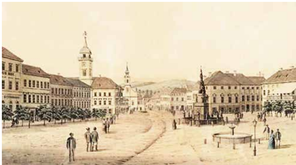
1. ábra. Pécs főtere a 19. század közepén 40

élt. 38 A püspökség, a káptalan, a székesegyház és a papnevelde azonban hatalmas uradalmakkal bírt a városon kívül, de voltak földjeik a városon belül is. 39 Az egyházi birtokok (szőlők, szántók, kertek stb.) művelése munkalehetőséget adott a helyi lakosság egy részének. Az egyházi szolgáltatások (mise, istentisztelet, temetés, házasság, iskola, árvagondozás, egyházi ünnepek tartása, egyházi építkezések stb.) nagy része érintette a pécsiek számos rétegét.