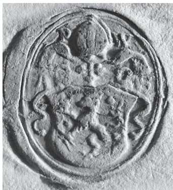
A somogy megyei Várday család címere

egy kígyó vagy sárkány körítette ágasfa látható. Ebből kiindulva Solymosi László az 1970-es években megállapította, hogy a későbbi esztergomi érsek és királyi helytartó nem a Szabolcs megyei előkelő kisvárdai, hanem a kevésbé jelentős Somogy megyei Várday családból származott. 1